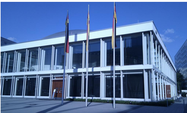
Abb. 3 Das Berliner Congress Centrum bcc - Tagungsort der Konferenz Zukünftiges Internet