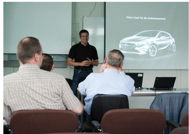
Abb. 2 4. Telematik-Treff

Am 1. Juli fand der 4. Telematik-Treff mit den Institutsteilen Telematics, DSN, Teco und SCC unter dem Motto 'Allgegenwärtiges Internet' statt. Das Institut für Telematik präsentierte sich mit Vorträgen aktueller Forschungsprojekte sowie einer großen Anzahl an Projektdemonstratoren, welche durch die Mitarbeiter des Instituts vorgestellt wurden. Eingeladen waren Alumni des Instituts für Te-