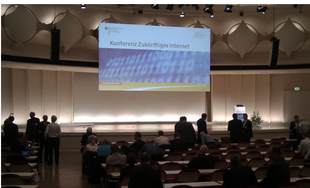
Abb. 4 Auditorium

Anfang Juli trafen sich Wissenschaft und Politik auf Initiative des BMBF (Bundesministerium für Bildung und Forschung) in Berlin (Abb. 3), um über die Weiterentwicklungen im Internet zu diskutieren. Die Spannweite der Themen war recht groß, so dass über sehr unterschiedliche Themen wie Sicherheit, Datenschutz, Informationsrecht und Informationsfreiheit aber auch technische Ansätze