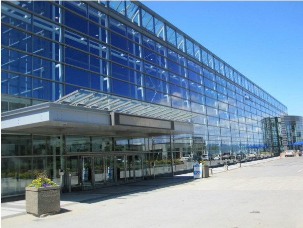
Abb. 6 Kongresszentrum Québec

staltete Podiumsdiskussion zum Thema "Internetentwicklung". Die schnelle Einführung von IPv6 war Thema gleich mehrerer Arbeitsgruppen. Darüber hinaus traf sich auch die Virtual Networks Research Group der IRTE, an der das Institut für Telematik aktiv beteiligt ist.